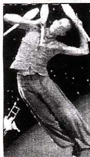
Una scena di «Albatros»