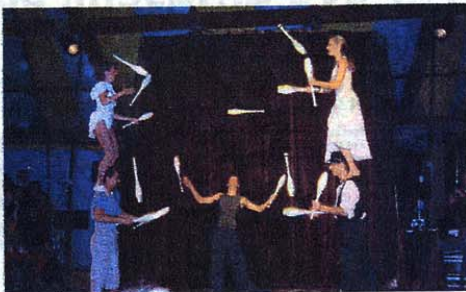
Un final aux massues en présence des artistes de la soirée

Émotion dont le chapiteau a transpiré tout au